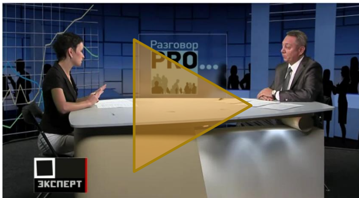
Телеинтервью в рамках программы «Разговор PRO» на канале Эксперт ТВ